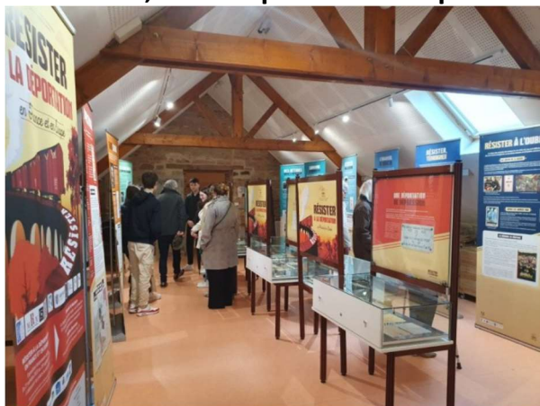
Exposition temporaire « Résister à la Déportation en France et en Europe » présentée à l'étage du musée

Comme chaque année, une nouvelle exposition temporaire est présentée à l'étage du musée en cours d'année, dont le sujet est issu du Concours national de la Résistance et de la Déportation (CNRD), coordonné par le Ministère de l'Éducation nationale.