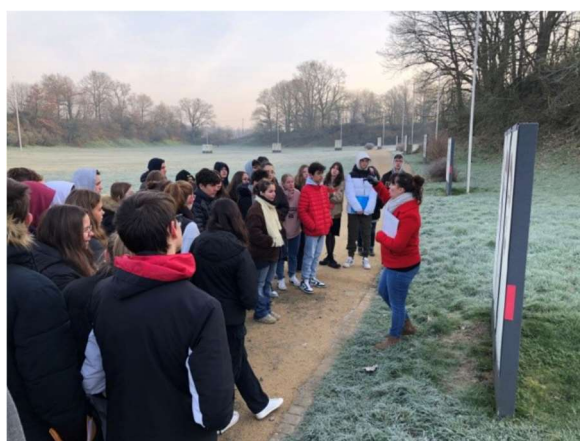
Quelques groupes en visite guidée au musée et à la Carrière des fusillés en 2023.

Cette année, le musée a accueilli de nombreux scolaires de différents niveaux et provenant de 28 établissements scolaires :