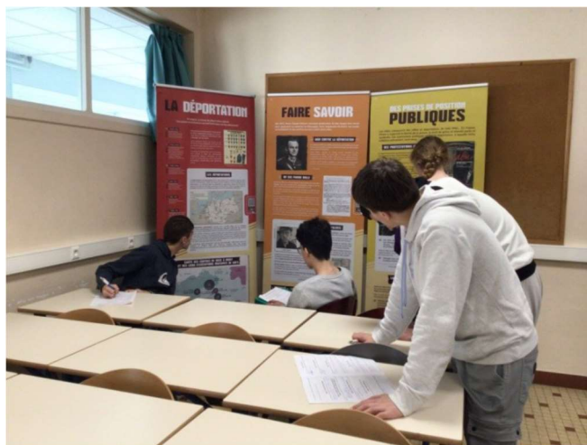
Exposition itinérante « Résister à la Déportation en France et en Europe » présentée au collège et lycée Saint-Joseph à Machecoul (44)