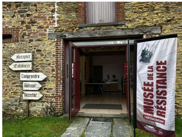
Entrée du Musée de la Résistance de Châteaubriant

Le musée se situe dans une ancienne ferme à l'entrée du site historique de la Carrière des fusillés à Châteaubriant (44). Inauguré en octobre 2001 , le musée est dédié aux internés du camp de Choisel, Voves, Rouillé et Aincourt, ainsi qu'aux otages fusillés le 22 octobre 1941 à Nantes, à Châteaubriant et au Mont-Valérien. L'ensemble du site historique classé appartient à l'Amicale Châteaubriant, Voves, Rouillé, Aincourt qui a confié la gestion du musée et son animation à l'association des Amis du Musée de la Résistance de Châteaubriant (AMRC).