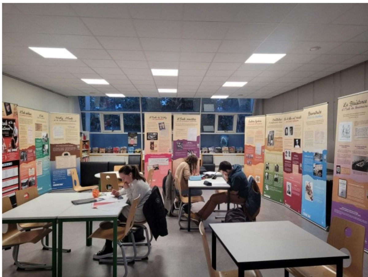
Exposition « L'École et la Résistance, 1940-1945 » présentée au Lycée Clemenceau à Nantes (44)

Cette année, l'itinérance des expositions a touché plus de 2700 personnes . Spécifiquement, il s'agit d'élèves ayant travaillé sur les expositions. Un comptage précis est impossible d'autant que la majorité des expositions sont installées dans un CDI, lieu de passage, ou même parfois présentées à l'occasion de portes ouvertes. Ce chiffre permet malgré tout d'estimer la fréquentation de ce projet d'itinérance, même à minima.