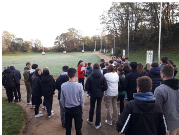
Quelques groupes en visite guidée au musée et à la Carrière des fusillés en 2022.